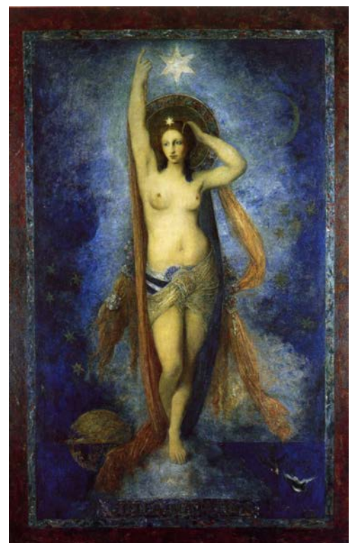
Stella Matutina, Georges Rouault, 1895